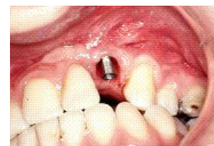
Billede 3-A. Her ses en anden kunstig tand. Et tandimplantat består af en titaniumstift, som sættes op i kæben, hvorefter man sætter en porcelænskronen på.

Når man er født med læbe-ganespalte mangler man tit tænder i spalteområdet. Tænderne i spalteområdet kan også være misdannede. Læbe-Ganespalte Centrets tandklinik tilbyder også her en behandling med erstatning af de manglende og misdannede tænder. Dette foregår i tæt samarbejde med patienten. Nedenfor på billede 2 og 3 er vist nogle eksempler på mulige behandlinger