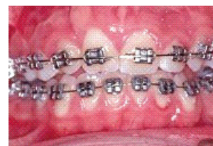
Billede 1. En fast bøjle – "togskinner".

Når alle de blivende tænder er brudt frem, er der behov for endnu en tandreguleringsbehandling. Dette sker med et fastsiddende apparatur – "togskinner", se billede 1. Behandlingstiden varierer meget, men gennemsnittet er på 2-3 år. Derefter kommer en "holdeperiode" med en natbøjle.