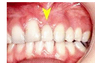
Billede 2. Dette er et eksempel på en "tand-bro". Den manglende tand (pil) er erstattet af en kunstig tand, det er koblet sammen med de to nabo-tænder.